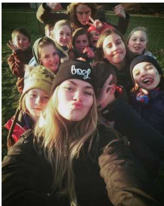
De rakwiboeven nemen een groepselfie nadat ze de wapens hebben neergelegd

boompje en struikje op de loer lag, te snel of te slim af te zijn.